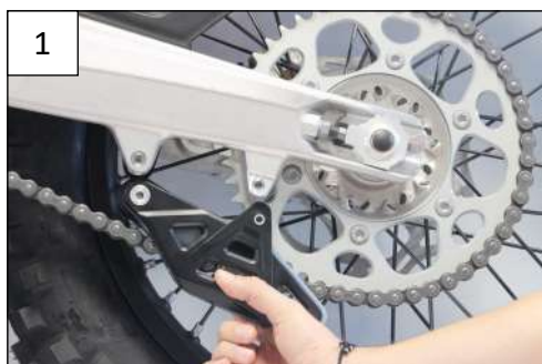
Remove the OEM chain guide Enlever le guide chaîne d'origine

Les photos ci-dessous ne représentent pas le même guide chaîne mais son montage est identique, merci de scanner et regarder la vidéo pour plus d'infos