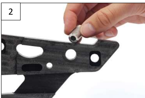
Place the alloy smooth spacer as indicated on the pictures Placer l'entretoise lisse comme indiqué sur les photos