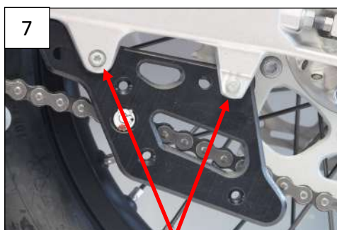
Use OEM screws Utiliser les vis d'origine