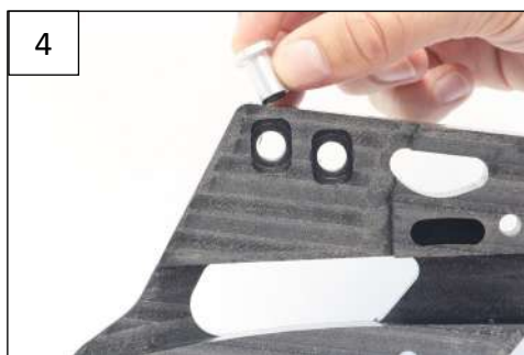
Place the threaded ring as indicated on the pictures Placer la bague taraudée comme indiqué sur les photos