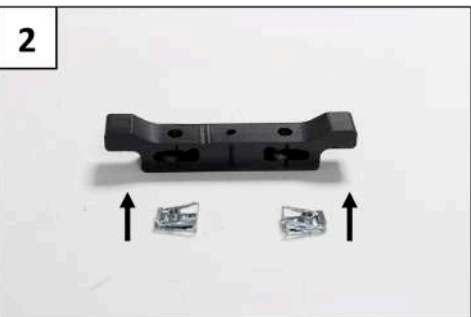
PM01-04-231 + Clamped bolts