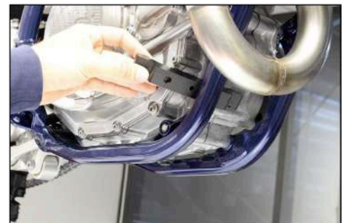
Place the front bracket by the side Placer la fixation par le côté