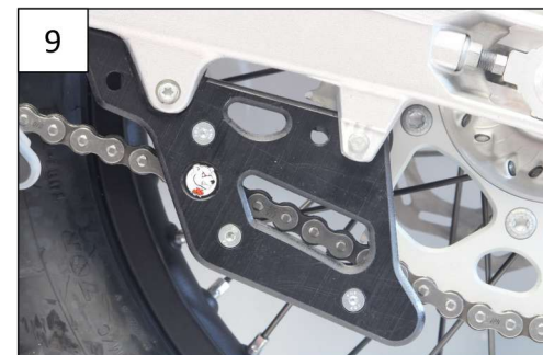
Placer le second bloc, clipser et serrer le tout avec les tfhc 6x55 + Rondelles M6 et les Em6f