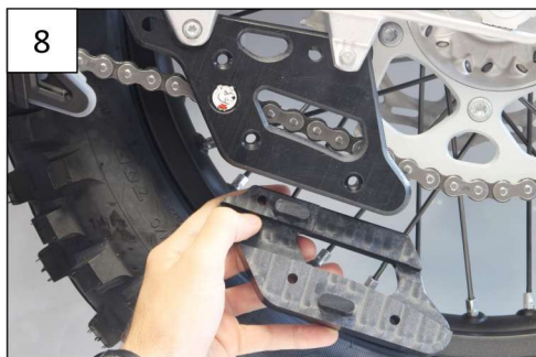
Place the second bloc, clip it and tight with the Tfhc 6x55mm screws, M6 Washers and em6f