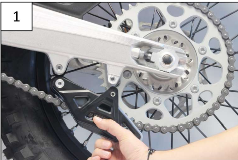
Remove the OEM chain guide Enlever le guide chaîne d'origine