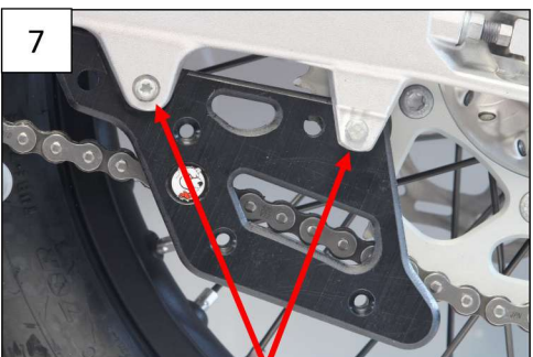
Use OEM screws Utiliser les vis d'origine