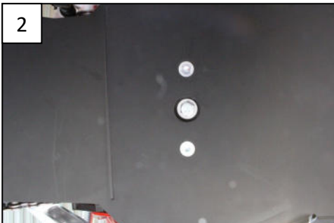
2 Fit the rear with the TH6x30mm Fixer l'arrière avec une TH6x30mm