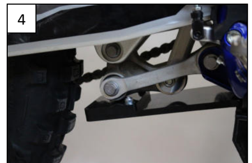
4 Fit the rear plastic part Fixer la pièce plastique arrière