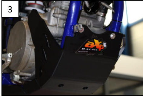
3 Fit the front using Th6x25mm Fixer l'avant a l'aide des Th6x25mm