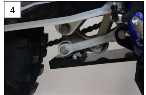
4 Fit the rear plastic part Fixer la pièce plastique arrière