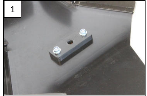
1 Fit the rear plastic part Fixer la pièce plastique arrière