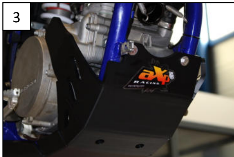
3 Fit the front using Th6x25mm Fixer l'avant a l'aide des Th6x25mm