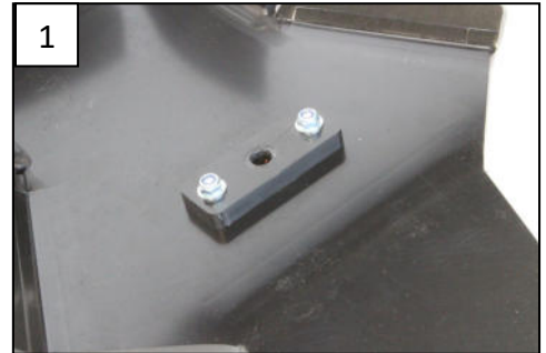
1 Fit the rear plastic part Fixer la pièce plastique arrière