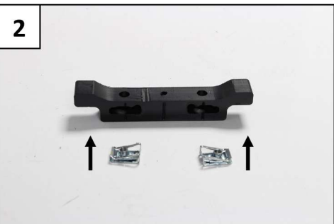
PM01-04-231 + Clamped bolts