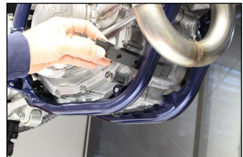
Place the front bracket by the side Placer la fixation par le côté