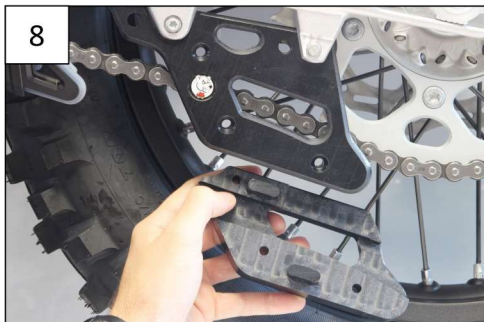
Place the second bloc, clip it and tight with the Tfhc 6x55mm screws, M6 Washers and em6f