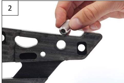
Place the alloy smooth spacer as indicated on the pictures Placer l'entretoise lisse comme indiqué sur les photos