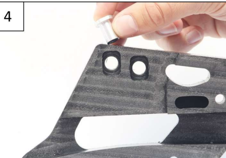
Place the threaded ring as indicated on the pictures Placer la bague taraudée comme indiqué sur les photos