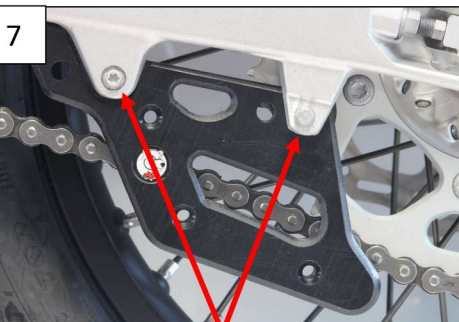
Use OEM screws Utiliser les vis d'origine