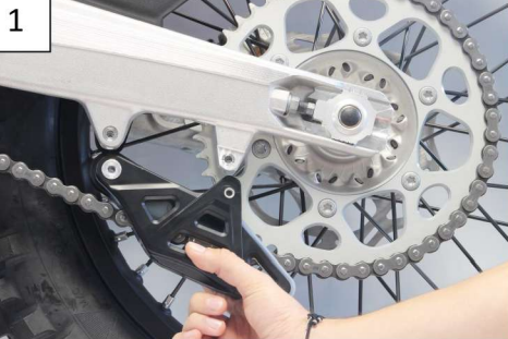
Remove the OEM chain guide Enlever le guide chaîne d'origine