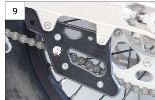
Placer le second bloc, clipser et serrer le tout avec les tfhc 6x55 + Rondelles M6 et les Em6f