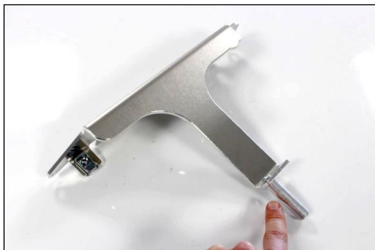
TBHC 6x16mm + 54mm spacer