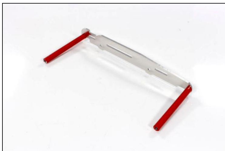
TBHC 6x16mm + Red spacers 122mm