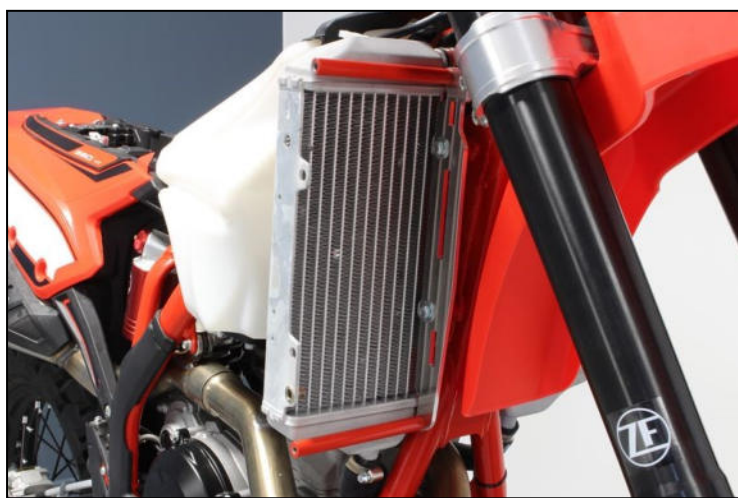
TBHC 6x16mm + Red spacers + M6 Large washers Fix the part on the frame Fixer l'ensemble sur le cadre