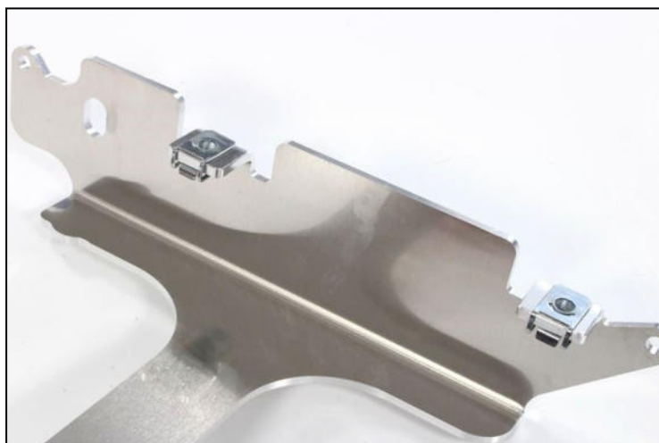
Clamped bolts Fix the clamped bolt as indicated Fixer les écrous pincés comme indiqué